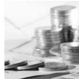
Banche: servono soluzioni per gli Utp