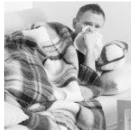
Falsa malattia, le aziende si affidano agli investigatori privati