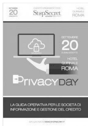
Seminario: PRIVACY DAY - La guida operativa per le società di informazione e gestione del credito