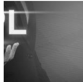
NPL: ACCORDO TRA INTESA SANPAOLO E INTRUM