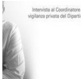
Investigare e fornire informazioni cosa sono?