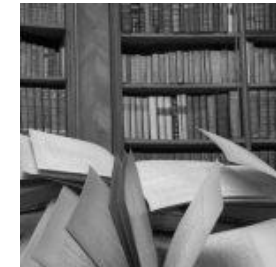
Differenze fra le attività d'informazioni commerciali e d'investigazione